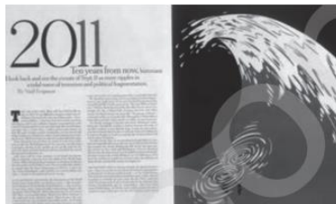
۱- در دو صفحه ی مقابل