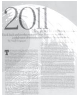
۲- در یک صفحه